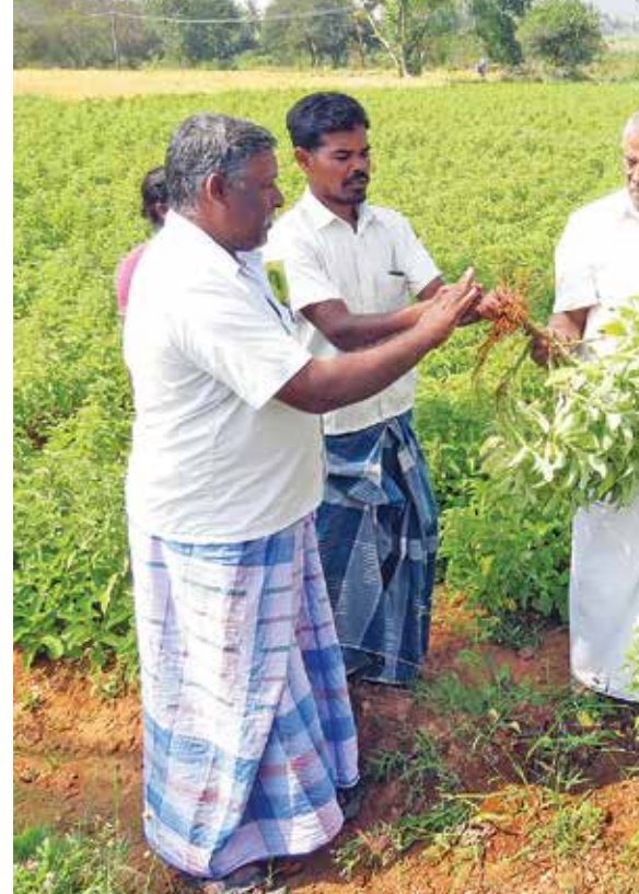
▲ வேளாண் மேம்பாடு தொடர்பான ஆய்வு மேற்கொள்ளும் மாணிக்கம் அத்தப்ப கவுண்டர்.

2013-ல் கண்வலிக் கிழங்கு விவசாயிகள் என்ன அணுகினாங்க. மருத்துவக் குணம் மிக்க விதை அது. உலகத்துல எங்கேயும் வணிக முறையில் உற்பத்தி செய்யப்படல. ஆனா, கஷ்டப்பட்டு கண்வலிக் கிழங்கு விதையை உற்பத்தி செஞ்ச நம்ம விவசாயிகளுக்கு, போதுமான விலை கிடைக்கலை. இது சம்பந்தமா விவசாயிங்க என்னதைத் தேடி வந்தாங்க. விசாரிச்சப்ப, சில கம்பெனிகள் மட்டுமே விவசாயிங்ககிட்ட இருந்து வாங்கி, விஷக்கடி, தசைப்பிடிப்பு, தேலநோயைக் குணப்படுத்தும் மருந்து தயார் செஞ்சும்கு தெரியவந்துச்சு. அந்த முதலாளிகள்கிட்டே பேசினப்ப, விலை விவகாரத்துல தலையிடாதீங்கனு சொன்னாங்க. உடனே, விவசாயிங்களை கூப்பிட்டு, நான் கண்வலிக் கிழங்கு விதையை விலைக்கு கேட்கிறேன்னு சொல்லுங்க. அப்பத்தான், கம்பெனிகாரங்க விலையை ஏத்துவாங்க. கிலோவுக்கு ரூ.1200 கேளுங்கனு சொன்னேன். விவசாயிங்களும அந்த விலை கேட்டாங்க. ஆனா, கம்பெனிகாரங்க அதை நம்பல. 'மிலிட்டரி கவுண்டர்'